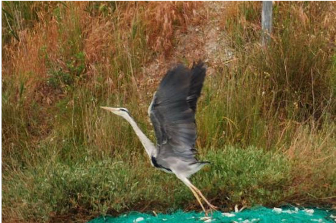
Εικόνα του Johnny di: *λαχτάρα*

Σαν έμαθες να ζωγραφίζεις σύννεφα Τα καβάλησες και ταξιδεύεις από τότε Είσαι γέφυρα ανάμεσα στους ουρανούς