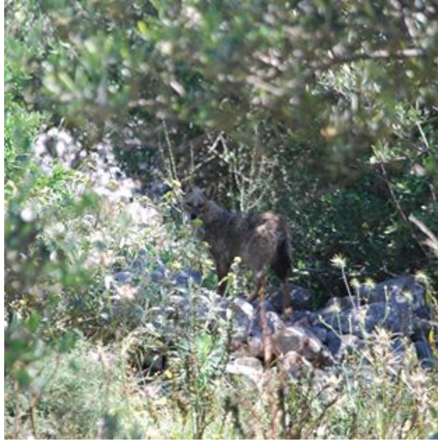
Εικόνα του Johnny di: *αυτοκτονία*

Πώς πυροβολείς το λύκο μέσα σου σε άλλου ουρλιαχτό;