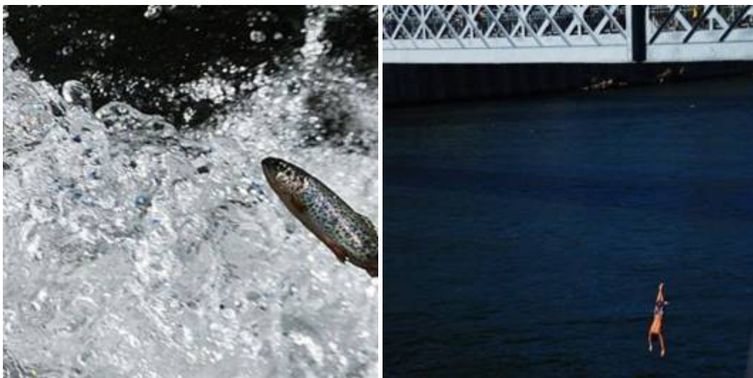
Εικόνες του Johnny di : *υπεκφυγή*

Το όνειρο όταν θα 'χει πια παντόφλες Στην όχθη με πνοή όταν βγει ιχθύς Δεμένος δε θα πέφτεις από γέφυρες Για μια φορά αληθινά θ' αγαπηθείς Καρπό έρωτα θα εμψυχώνεις επί Γης